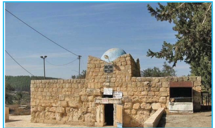
מקום קבורתו - רבי יהודא הנשיא