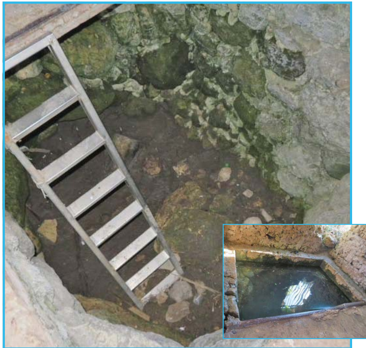
מקוה מיוחס לרבי יהודה נשיאה

בשעת פטירתו, האט רבינו הק' אויפגעהויבן זיינע צען פינגערס, און געזאגט רבנו של עולם, איך האב מיך מייגע געווען אויף דיין תורה מיט אלע צען פינגערס, און איך האב נישט נהנה געווען פון דער וועלט אפי' באצבע קטנה, יהי רצון מלפניך שיהא שלום במנוחתו, איז ארויס א בת קול, יבוא שלום ינוחו על משכבותם, זכותו יגן עליו.